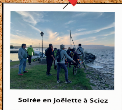
Soirée en joëlette à Sciez