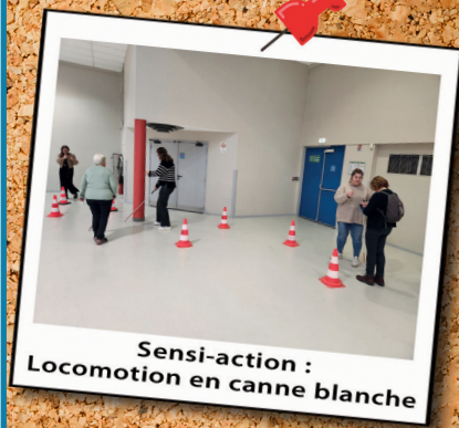
Sensi-action : Locomotion en canne blanche