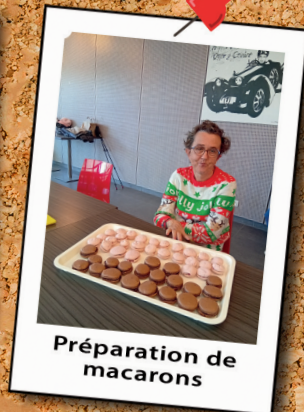
Préparation de macarons