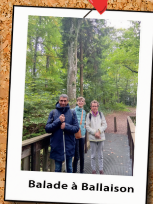
Balade à Ballaison