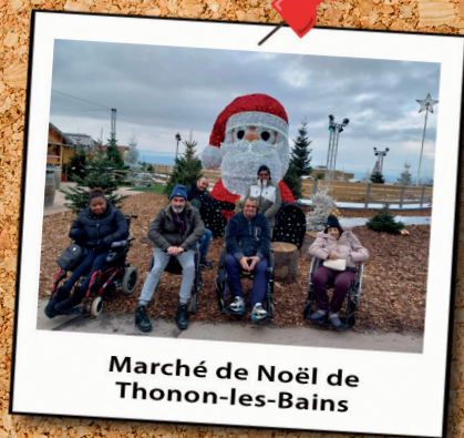
Marché de Noël de Thonon-les-Bains