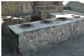
Exemple de thermopolia

La cuisine génère du lien entre les individus. Se retrouver autour d'un repas, c'est partager bien plus que de la nourriture. Cela peut être un moment de plaisir, de communication et de rapprochement. Le repas peut suivre un rituel (repas du dimanche, dîners de fêtes) ou être improvisé dans le but d'être ensemble. Dans tous les cas, il demeure un espace social, un temps suspendu où les barrières s'effacent et où la parole circule librement.