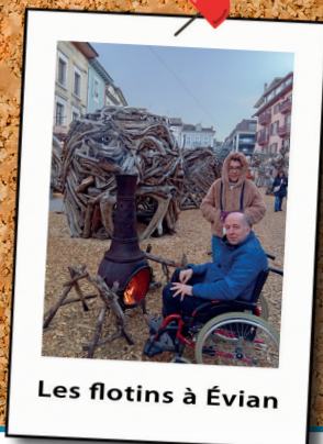
Les flotins à Évian