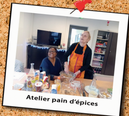
Atelier pain d'épices