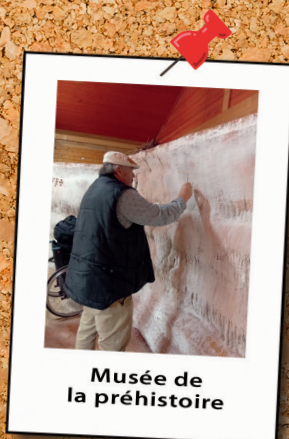
Musée de la préhistoire