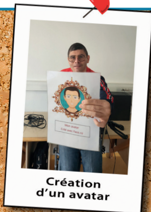
Création d'un avatar