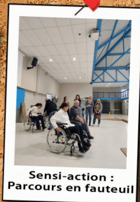
Sensi-action : Parcours en fauteuil