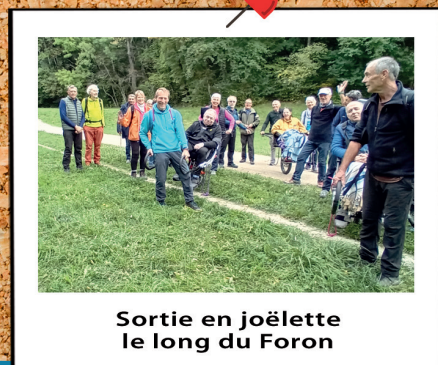
Sortie en joëlette le long du Foron